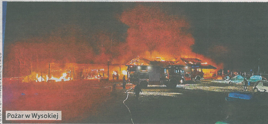
Pożar w Wysokiej

Kolejny pożar wybuchł w sobotę, 16 listopada, około 18.50 w Ranczo Zwierzyniec w Wysokiej (powiat su-