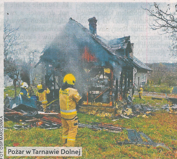
Pożar w Tarnawie Dolnej

Ośmiu kierowców straciło prawo jazdy za przekroczenie prędkości aż o 50 km/h w obszarze zabudowanym na ul. Kościuszki w Choczni pomiędzy 8 a 10 listopada. Kierowca audi z powiatu oświęcimskiego miał 108 km/h na liczniku. Kilka minut po nim zatrzymano kolejnego mieszkańca powiatu oświęcimskiego, który jechał hyundaiem