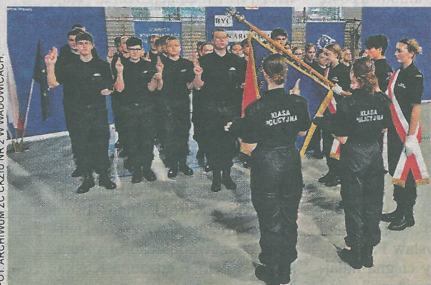
Uczniowie pierwszej klasy licealnej o profilu policyjnym w „Gorzeniu”, złożyli uroczyste ślubowanie.

durowych - policji, straży pożarnej i służby więziennej. Po ceremonii ślubowania adepci służb mundurowych zaprezentowali efektowny pokaz musztry i sztuk walk. (szpil)